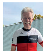
Auszug aus dem Jahresbericht des technischen Leiters Joachim Klam

Die erste Tagestour, die durchgeführt werden konnte, war die Ausfahrt am 27. Mai nach Mellingen-Mutschellen. Bei den Tagestouren konnten von 12 geplanten 9 Ausfahrten durchgeführt werden. Am meisten Zuspruch hatten die Ausfahrten «Heitersberg» mit 21 Teilnehmern, sowie die Ausfahrten «Ruswil-Hildisrieden» und «Menzingen-Rothenthurm» mit 18 bzw. 16 Teilnehmern. Im Schnitt kamen zu den 9 durchgeführten Tagesausfahrten 14 Velofahrer. Dies liegt über dem Schnitt vom letzten Jahr, in dem wir 12,2 Teilnehmer hatten.